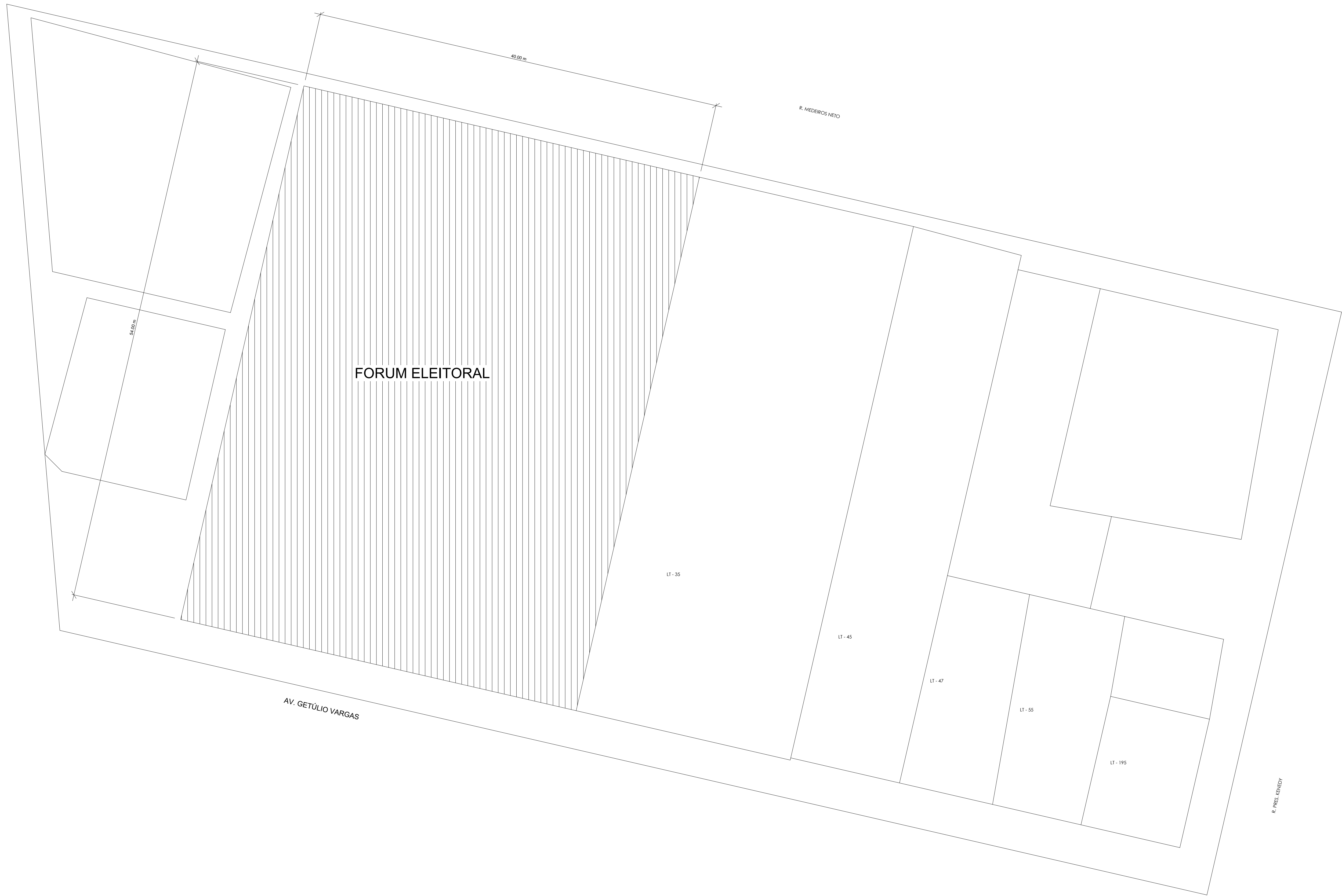
3 SITUAÇÃO 1:200